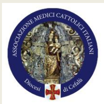
AMCI –Diocesi DI Cefalù