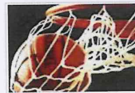
Basket: Cefalù perde amichevole con Palermo