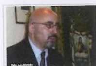
Consiglio Comunale: 17 punti da discutere