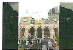
Video Gibilmanna6 2016