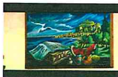
La Grun - Giornale di Cefalu' ...