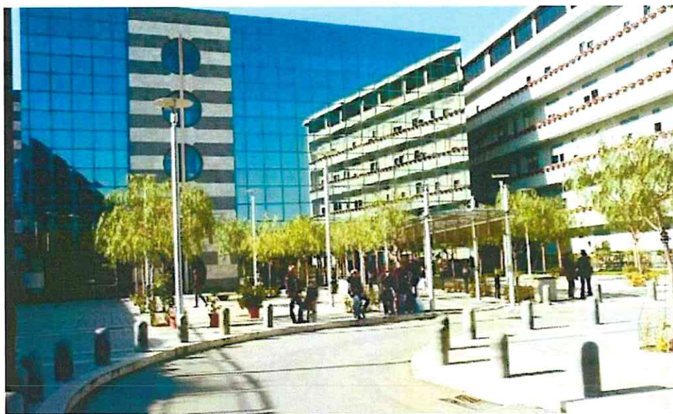
Oltre agli esami già introdotti, previsti a breve al Giglio anche nuovi esami in campo oncologico

L'unità Valutazione Alzheimer (Uva) del Giglio è al decimo anno di attività. Segue oltre 500 pazienti e in atto ha ben dodici studi sperimentali utilizzando farmaci innovativi per il trattamento delle demenze.