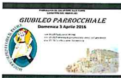
Giubileo Misericordia 2016 - V...