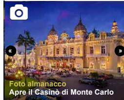
Apre il Casinò di Monte Carlo